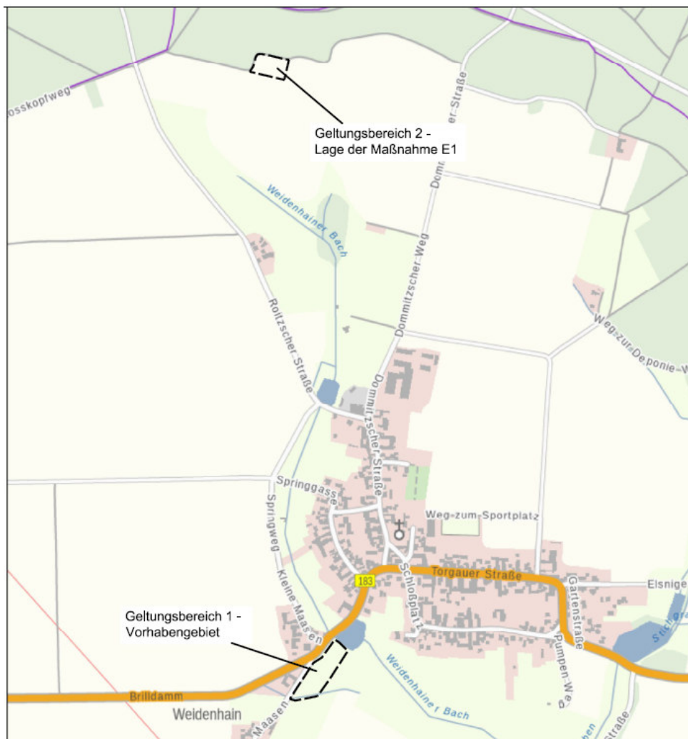
Abbildung 1 - Übersichtsplan Geltungsbereich:

Von der Planung betroffen sind im Geltungsbereich 1 die Flurstücke 122 (Teilfläche), 118/4 (Teilfläche), 460 (Teilfläche), 461 der Flur 4 in der Gemarkung Weidenhain.