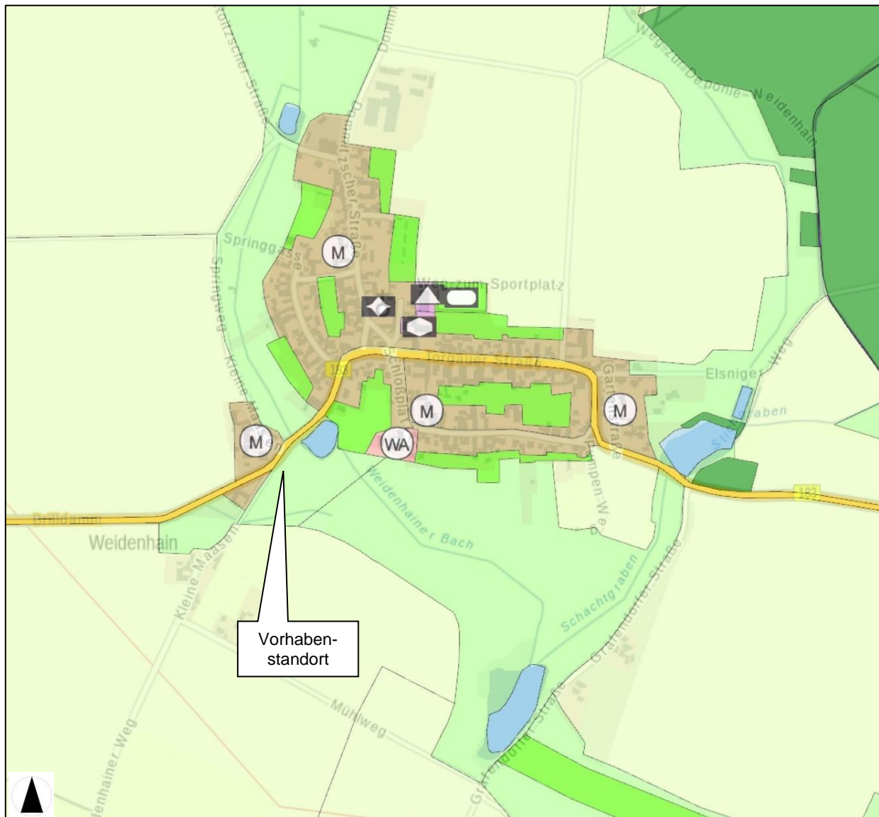
Abbildung 3: Auszug aus Vorentwurf-FNP der VG Torgau-Dreiheide-Pflückuff-Zinna (o. Maßstab)

Für das Vorhabengebiet existiert der Vorentwurf eines Flächennutzungsplanes (FNP) der Verwaltungsgemeinschaft Torgau-Dreiheide-Pflückuff-Zinna mit Stand von 10/2005. Ein Ausschnitt aus dem Vorentwurf des FNP wird in Abbildung 3 dargestellt.